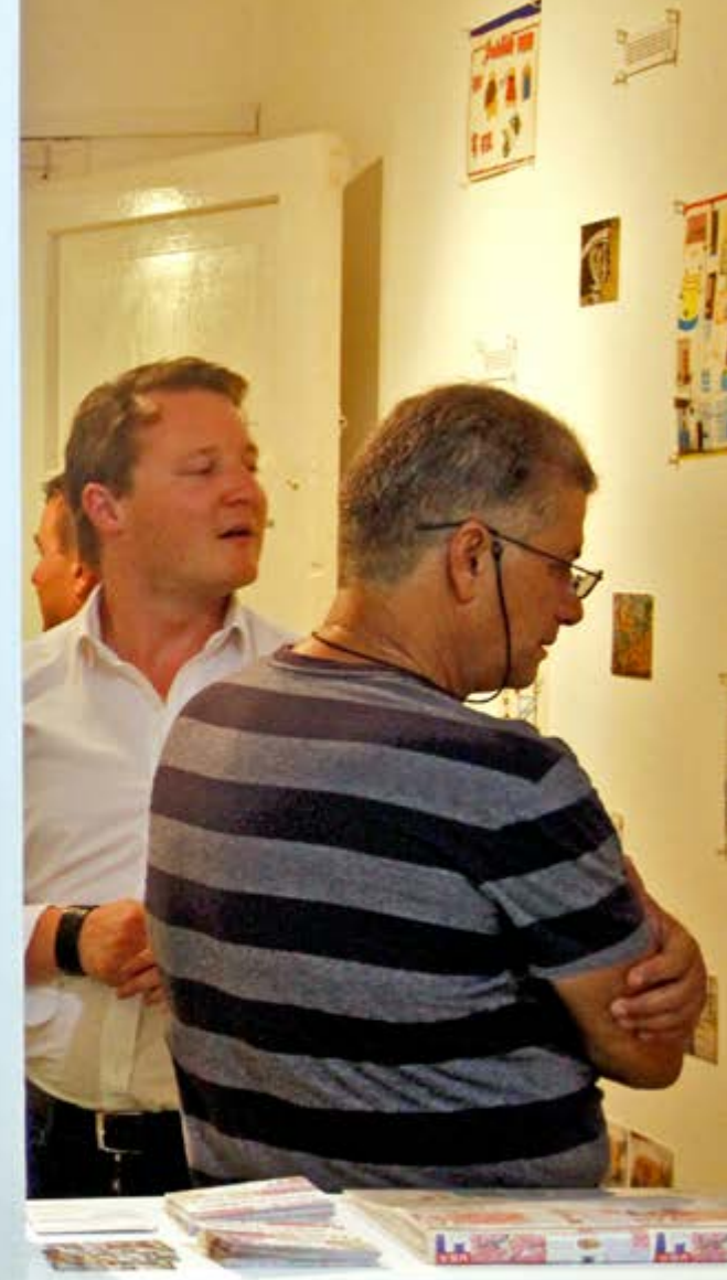
Ausstellungseröffnung am 12.09.2015