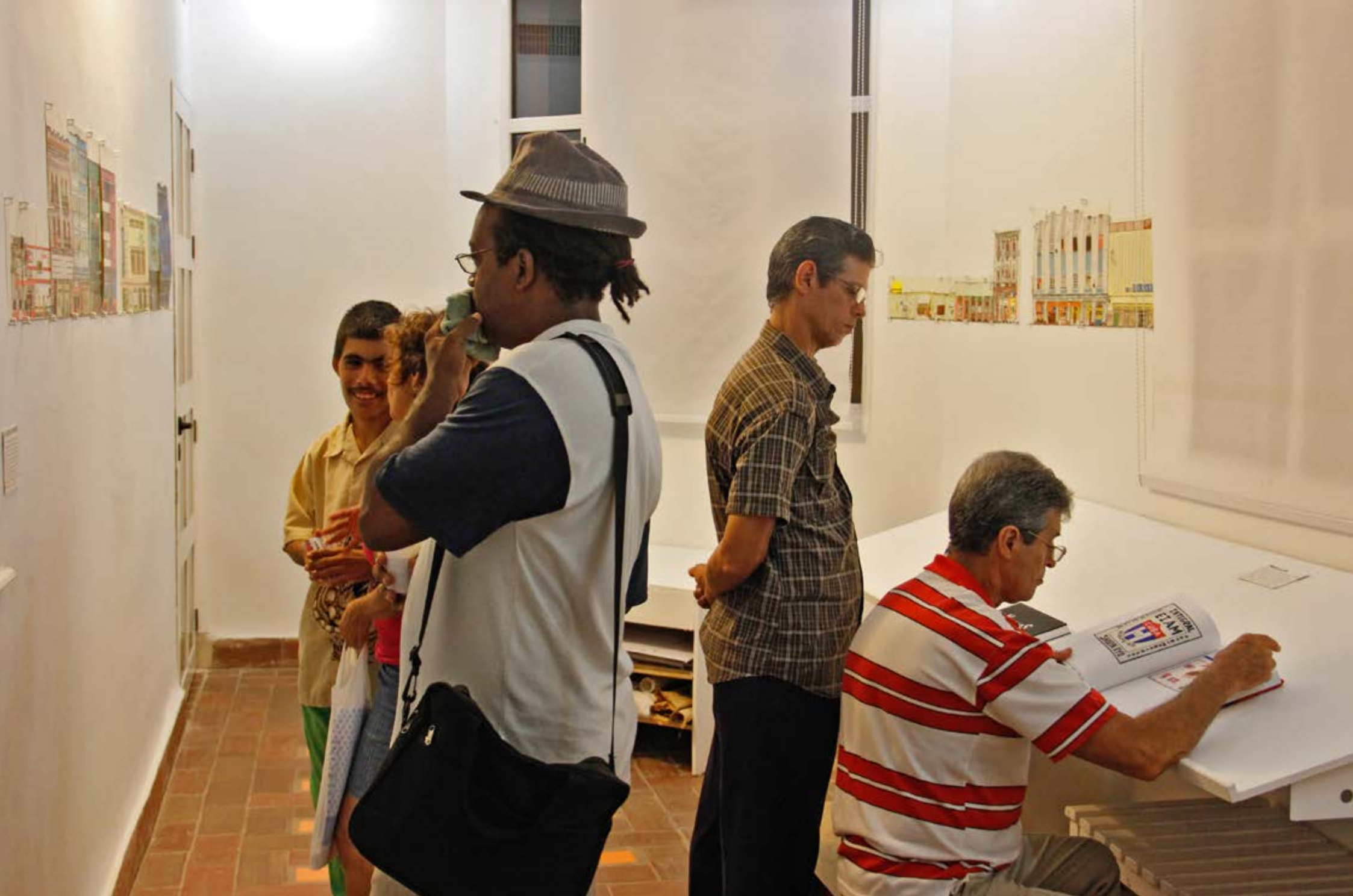
Ausstellungseröffnung am 12.09.2015