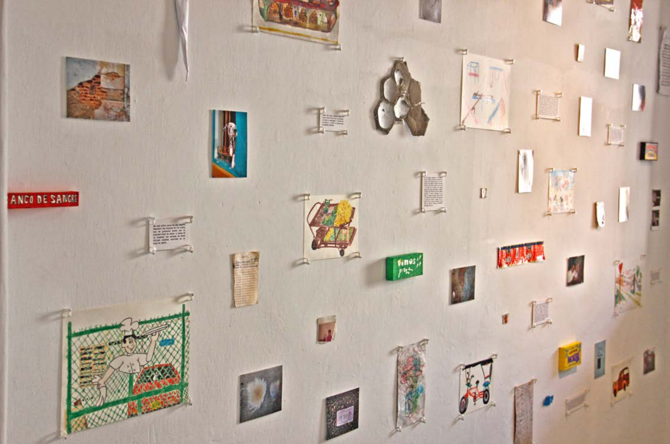
Detailansicht | Acumulación | Wandinstallation | Fotografien, Zeichnungen, Notizen und Fundstücke | Größe ca. 580 x 200 cm