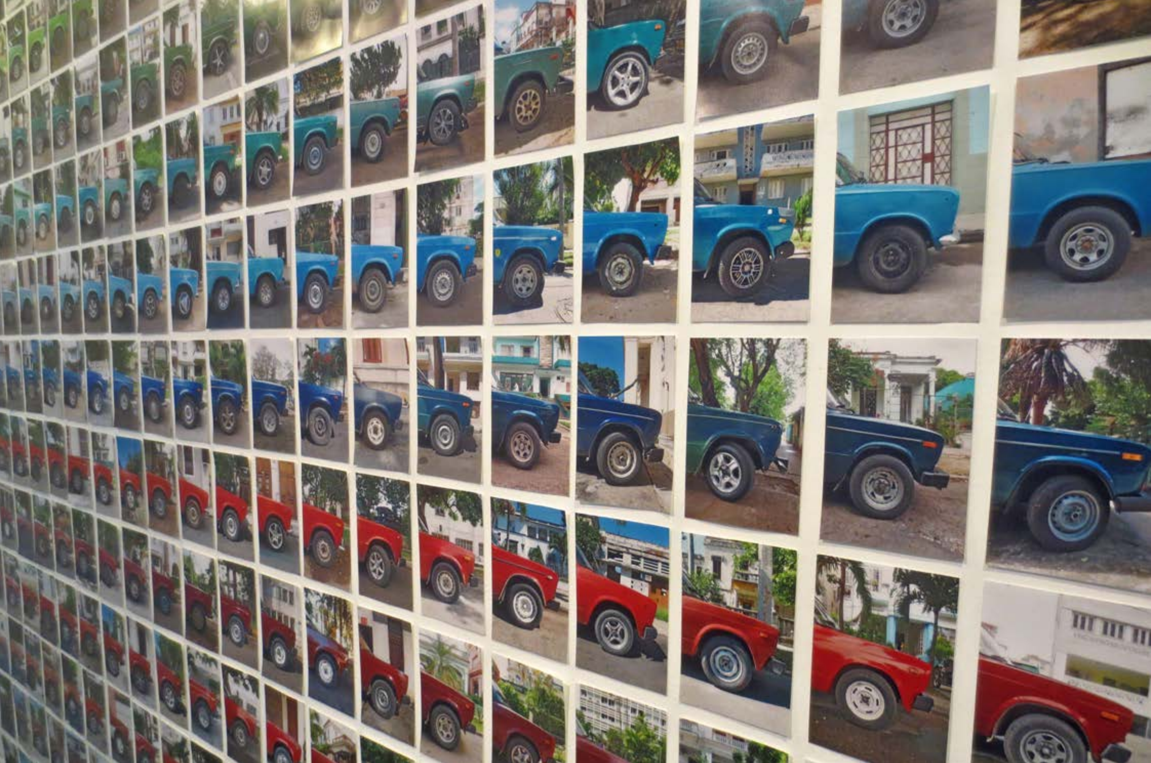
Detailansicht | 300 Ladas desde La Habana | Serie von Fotografien | Digitaldruck auf Fotopapier | Größe 280 x 295 cm