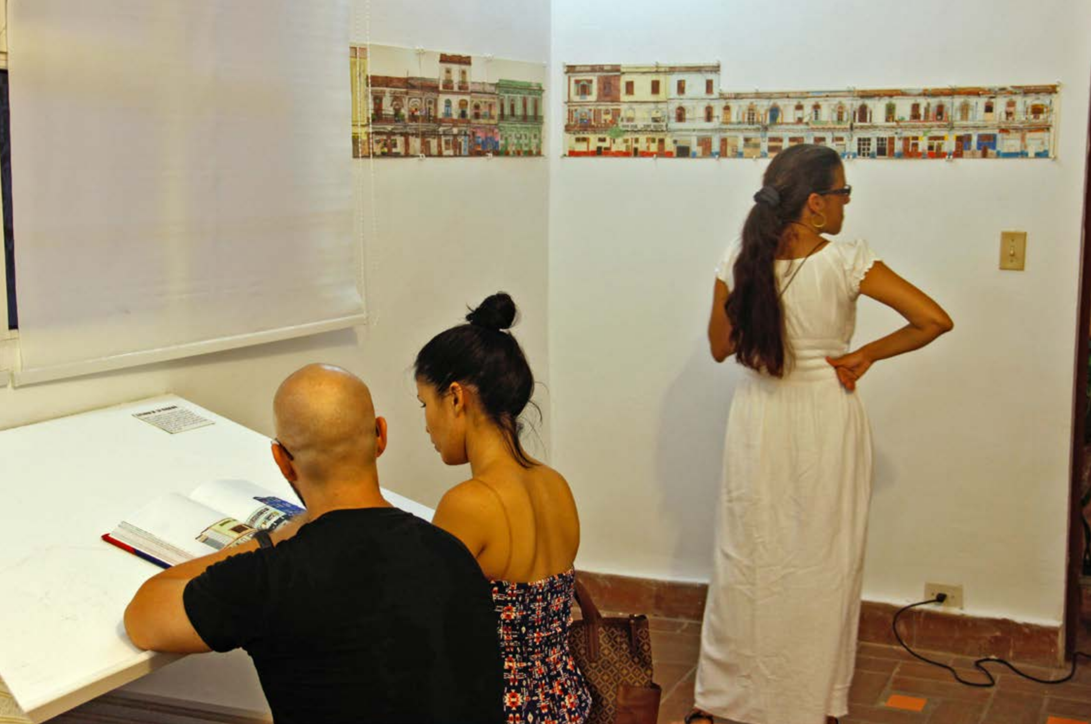
Ausstellungseröffnung am 12.09.2015