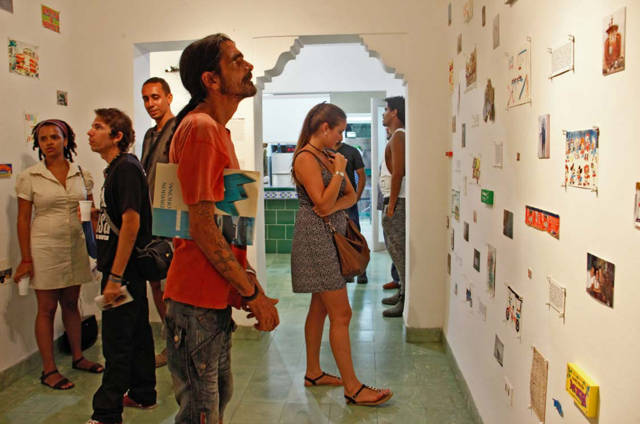
Ausstellungseröffnung am 12.09.2015