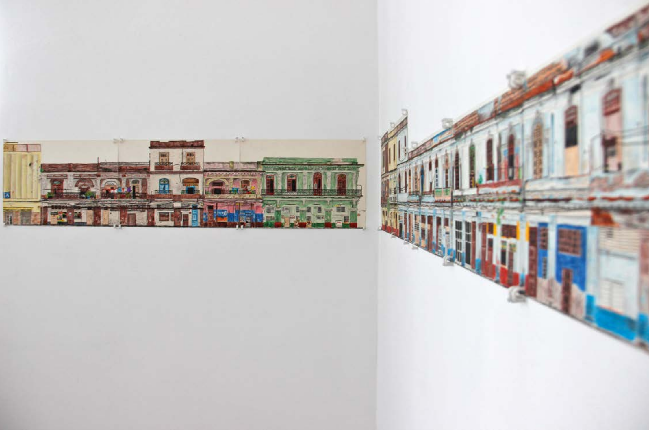
Detailansicht | La Calzada de Infanta | Serie von Zeichnungen | Buntstift auf Papier | Größe 980 x 45 cm