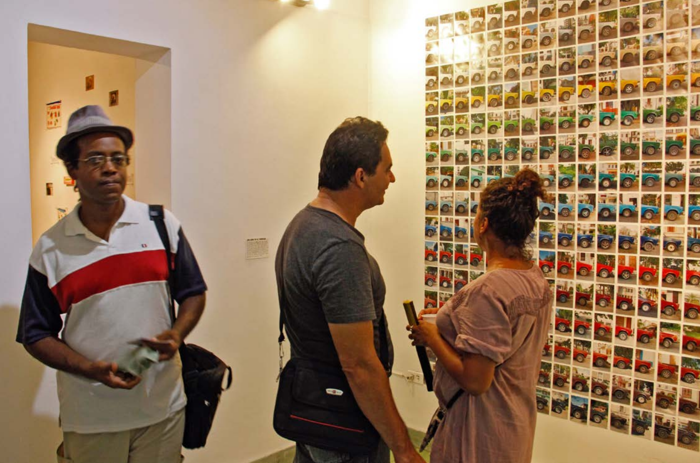
Ausstellungseröffnung am 12.09.2015