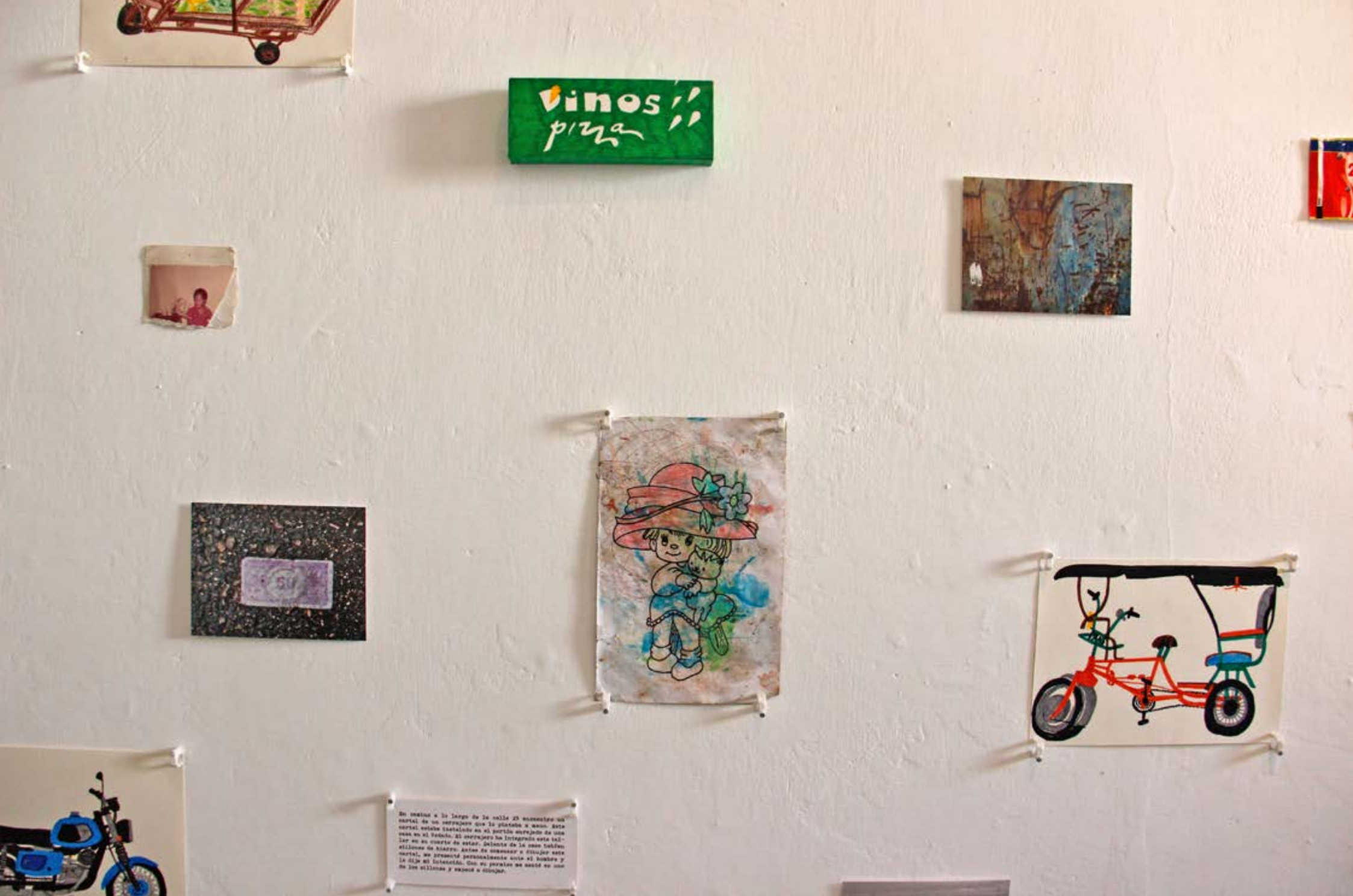
Detailansicht | Acumulación | Wandinstallation | Fotografien, Zeichnungen, Notizen und Fundstücke | Größe ca. 580 x 200 cm