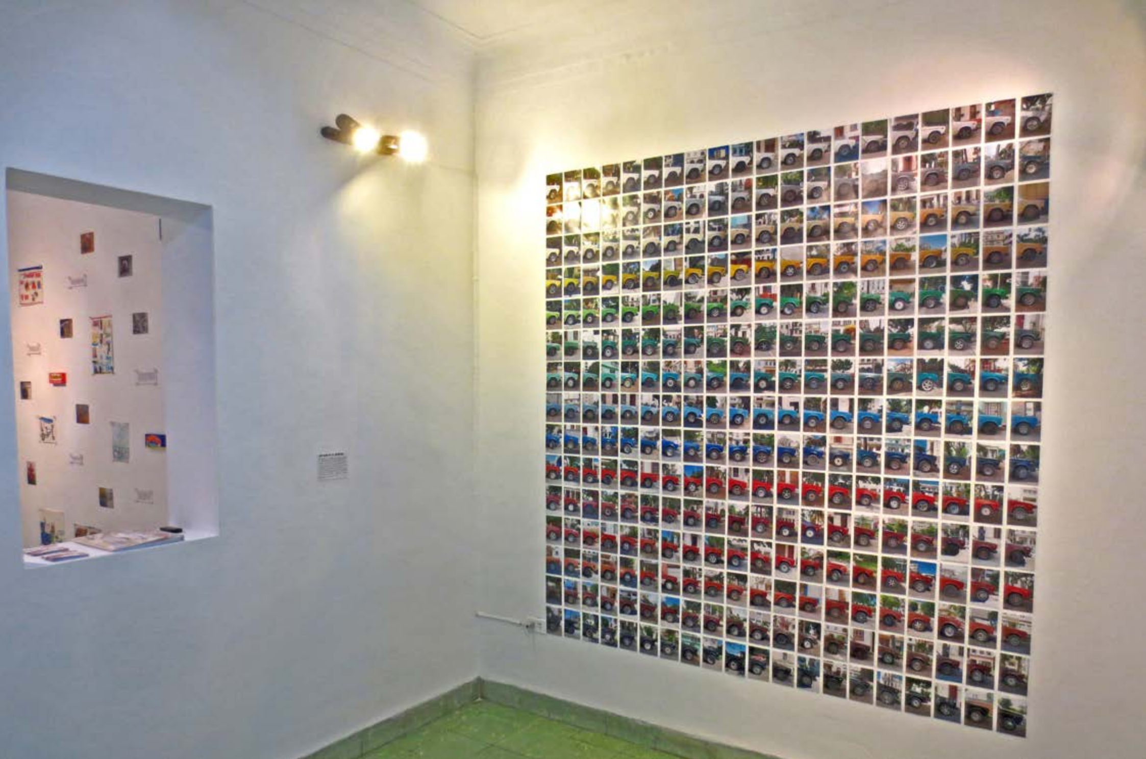
Ausstellungsansicht | 300 Ladas desde La Habana | Serie von Fotografien | Digitaldruck auf Fotopapier | Größe 280 x 295 cm