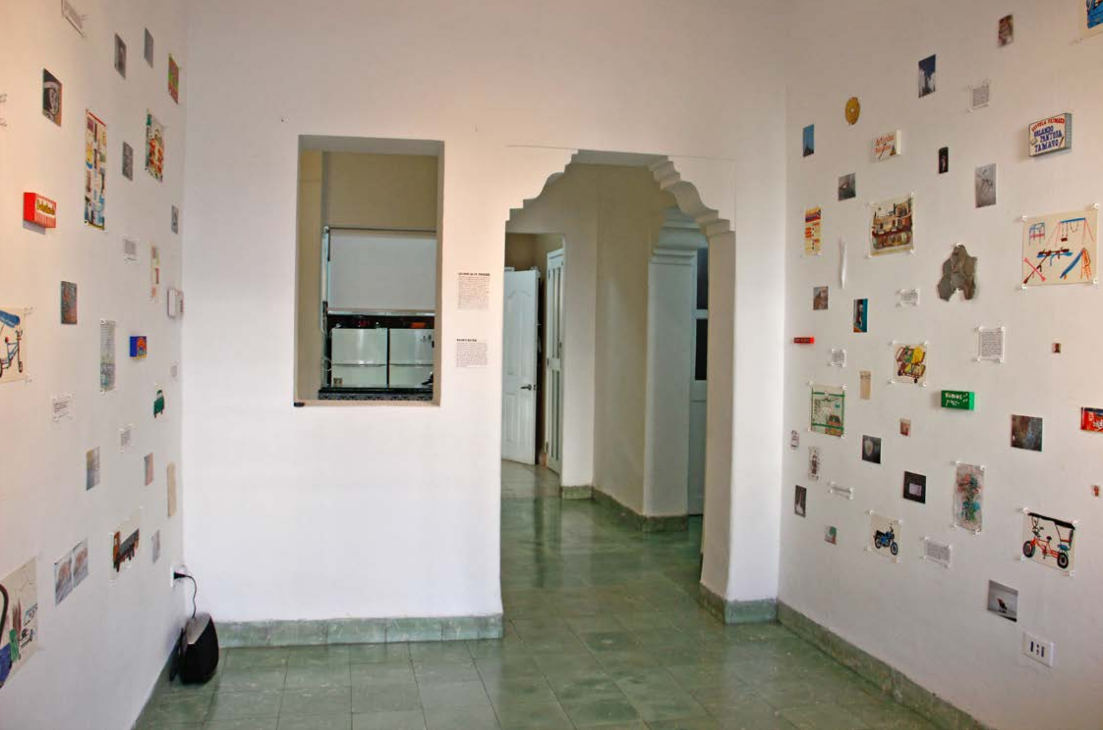
Ausstellungsansicht | Acumulación | Wandinstallation | Fotografien, Zeichnungen, Notizen und Fundstücke | Größe ca. 580 x 200 cm